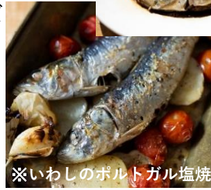
※いわしのポルトガル塩焼き