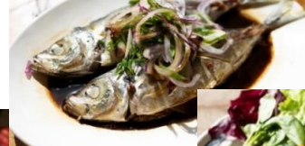
※あじのエスニック蒸し