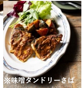
※味噌タンドリーさば